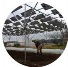
ソーラーシェアリング