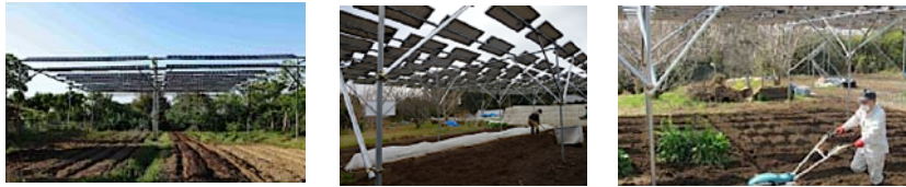
@ソーラーシェアリング (耕作地を維持しながら上空で発電するシステム)